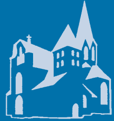
HelenaBote St. Helena Rheindahlen