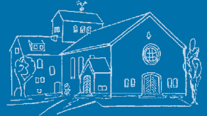
Nachrichten der Grabeskirche St. Matthias Günhoven