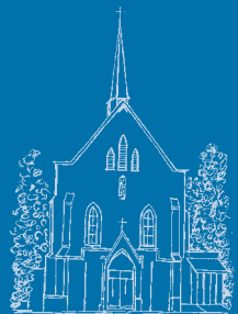
Pfarrbrief St. Rochus Broich-Peel