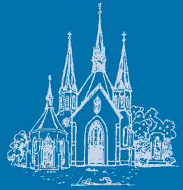
Pfarr- und Wallfahrtsbrief St. Mariä Heimsuchung Hehn