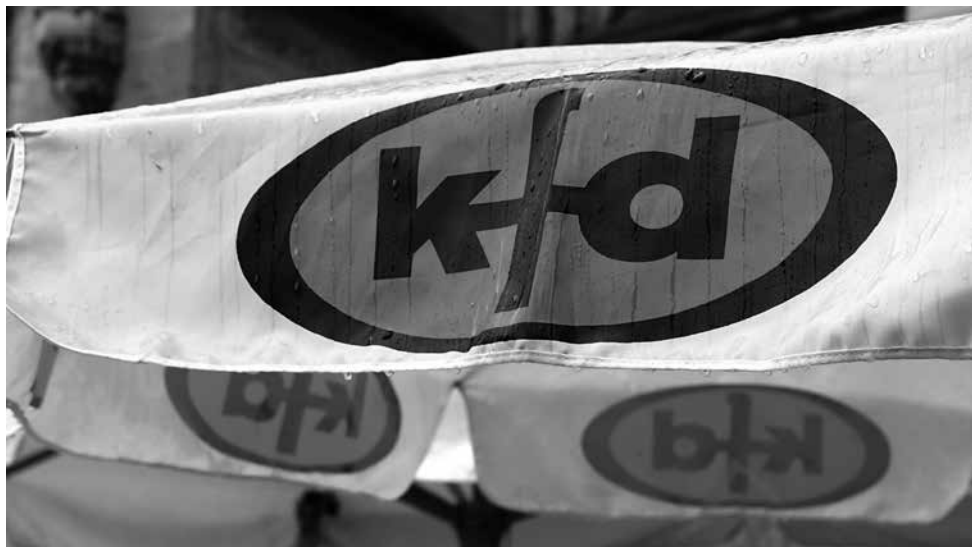
Lässt Frauen nicht im Regen stehen

Die Musikgruppe findet im Rahmen der musikalischen Früherziehung wöchentlich donnerstags für Babys und Kleinkinder von 9.30 - 12 Uhr im Helenatreff, Mühlenwallstr. 73, Seiteneingang statt. Anmeldung: 02166 131077.